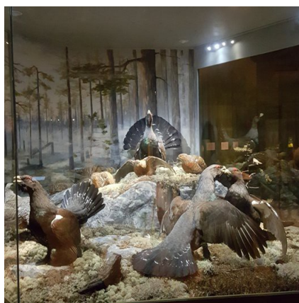
Tjäder - som vårt klassrum heter!