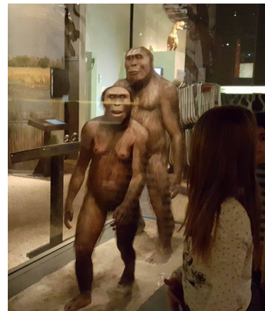
Australopithecus och nutida Homo sapiens sapiens