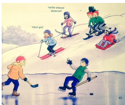
Hög och låg friktion